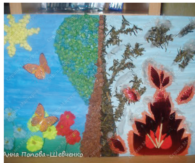
Инспектор отделения организации надзорной деятельности ОНД по г. Красноярску ст. лейтенант внутренней службы С.В. Очкина

Поделки могут быть выполнены практически и из природного материала. Например, для такой цели можно использовать шишки, желуди, каштаны, сухие листья и веточки, из которых получаются прекрасные поучительные поделки на тему пожарной безопасности.